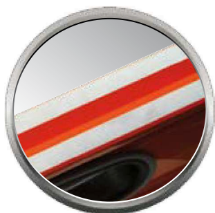
Semelle rectifiée : grande précision