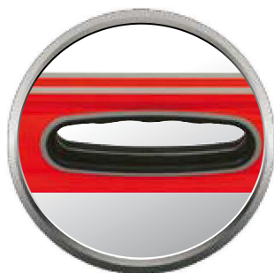
Poignées bi-matière : excellente ergonomie