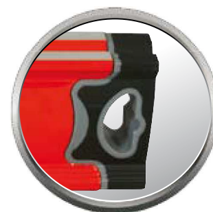
Emboutis en caoutchouc bi-matière : absorbe les chocs