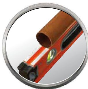
Semelle en «V» : idéal pour s'adapter sur les tubes